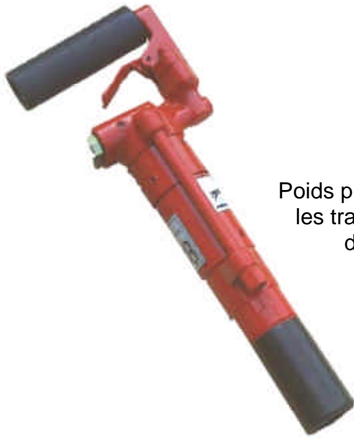
TNT 6 Poids plume, précis pour les travaux de petites démolitions